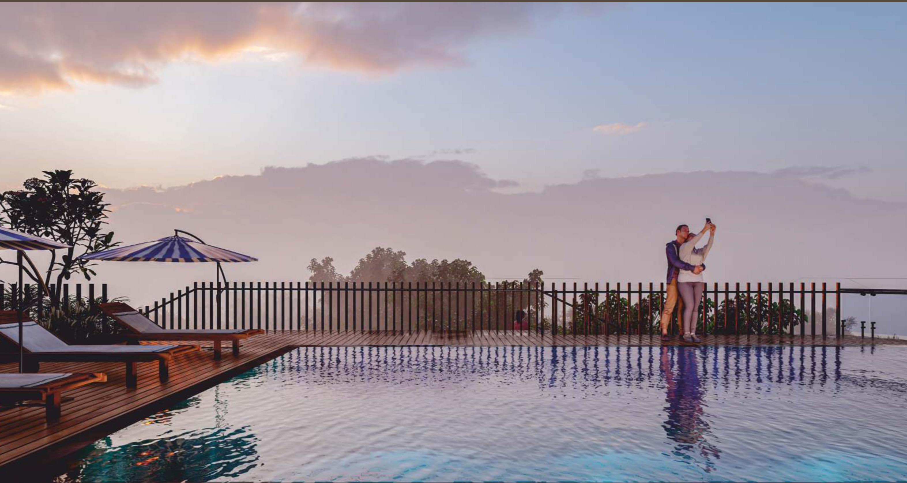
Swimming Pool & Deck