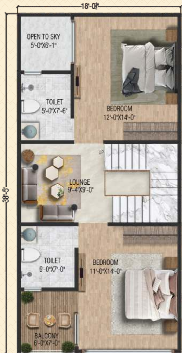
FIRST FLOOR PLAN