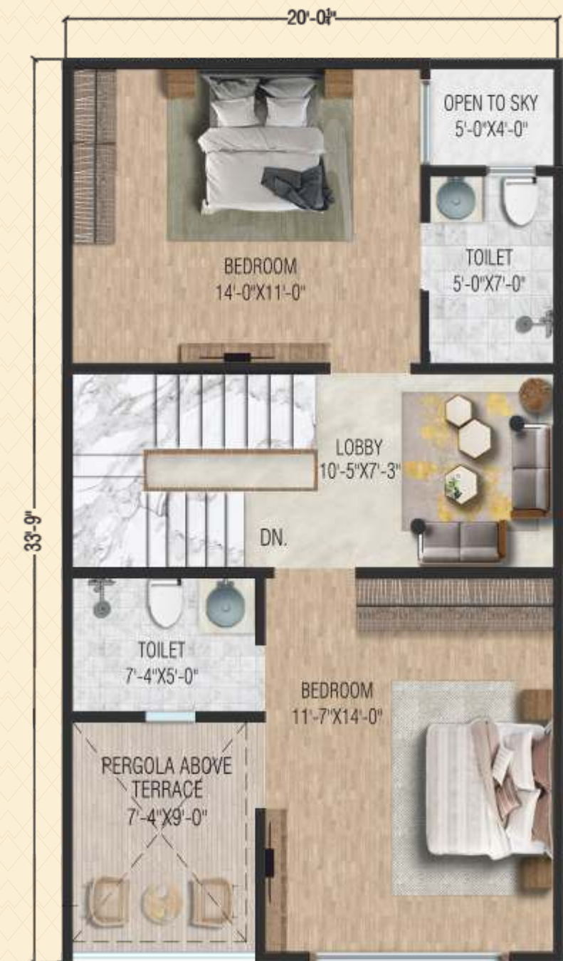
SECOND FLOOR PLAN