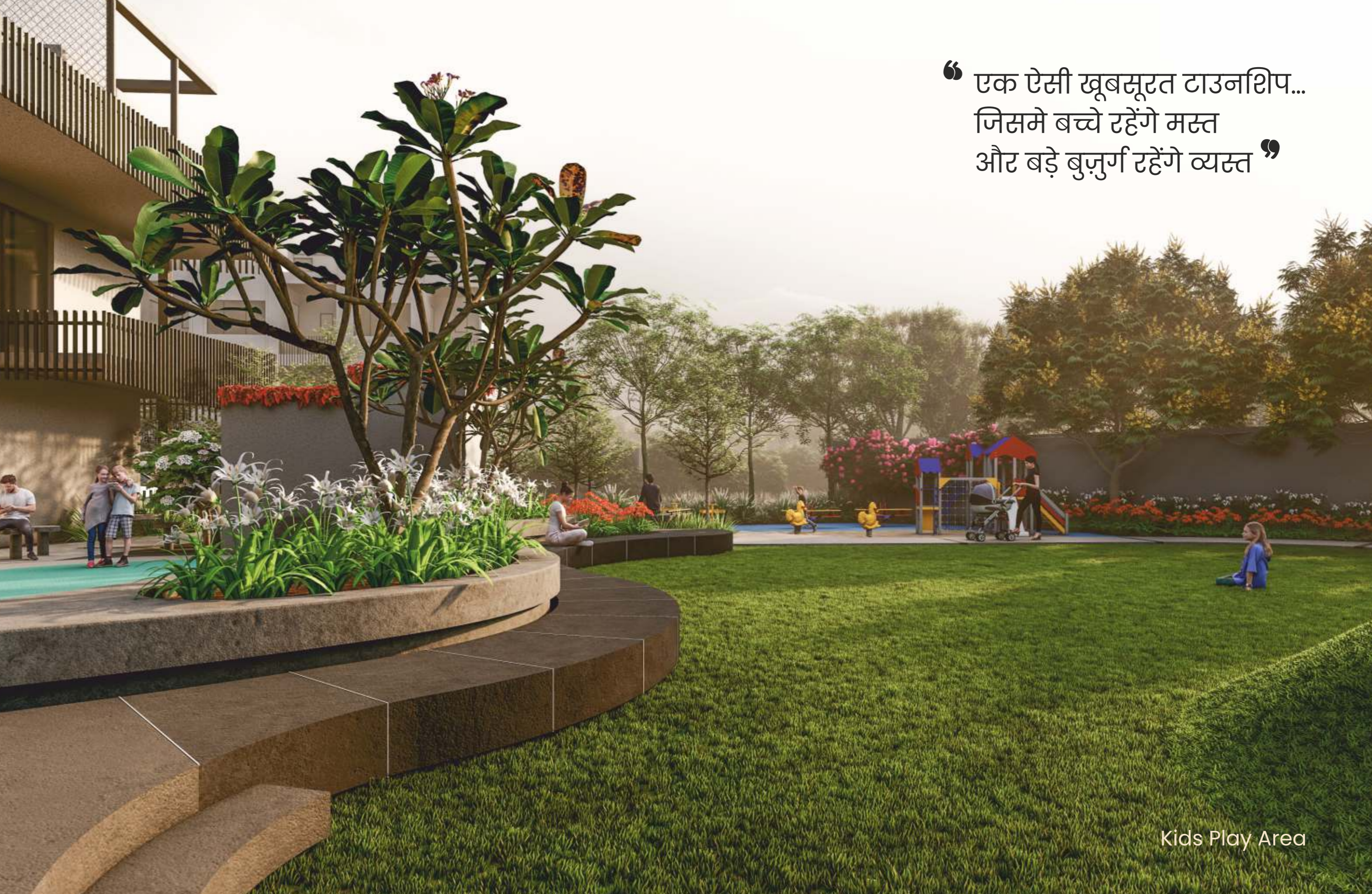
Kids Play Area

“ एक ऐसी खूबसूरत टाउनशिप... जिसमे बच्चे रहेंगे मस्त और बड़े बुज़ुर्ग रहेंगे व्यस्त ”